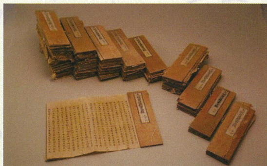
▲文殊院蔵「大般若経」（天保8～12年）