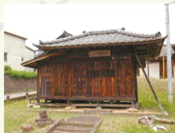
▲文殊院（常陸太田市天神林町）

佐竹一族の故郷・佐竹郷（常陸太田市天神林町）に所在する文殊院には、水戸光圀の手で薩都神社から移された、小野崎氏寄進による「大般若経」があると伝えられてきました。2019年、この寺の須弥壇の下から大量の經典類が見つかり、その整理が茨城史料ネットに託されました。コロナ禍による停滞を乗り越え、作業の最終盤の確認作業の中で、残欠の中から、「応永八年」の年紀をもつ小野崎氏寄進の「大般若経」の断片（第291巻の最奥の一紙）が発見されたのです。