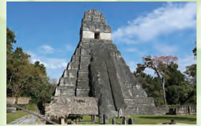
グアテマラ世界遺産のティカル遺跡の神殿1

【会場】 水戸キャンパス図書館3階ライブラリーホール、 オンライン(Zoom) 要事前予約