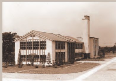
昭和27年頃の図書館(本館) (現在の生協の場所)

2019年度、茨城大学は創立70周年を迎えます。節目の年を記念し、創立期の写真を中心に古き時代の茨城大学の姿をふりかえります。本学図書館、水戸市立博物館、多賀工業会が所蔵する写真から、昔の学生の姿や装い、大学の建物の在りし日の光景をご紹介します。