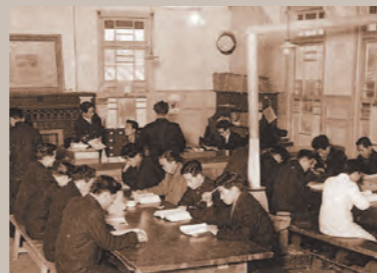
昭和28年頃の農学部図書館閲覧室