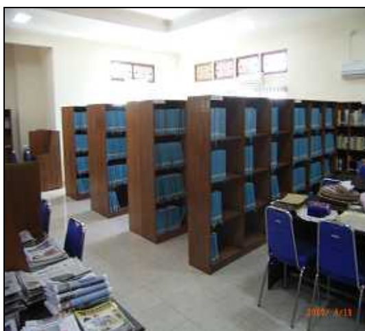
論文（全部で4架ある）

正面の右側には、修士及び博士論文が配架されている。なお、論文は分厚いものも多く、なかには600ページほどの論文もいくつかあった。