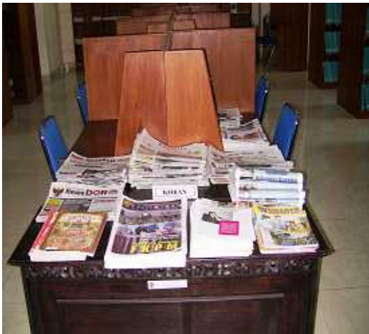
今月分の新聞が置かれている机