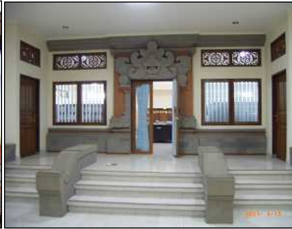
大学院図書館の入口