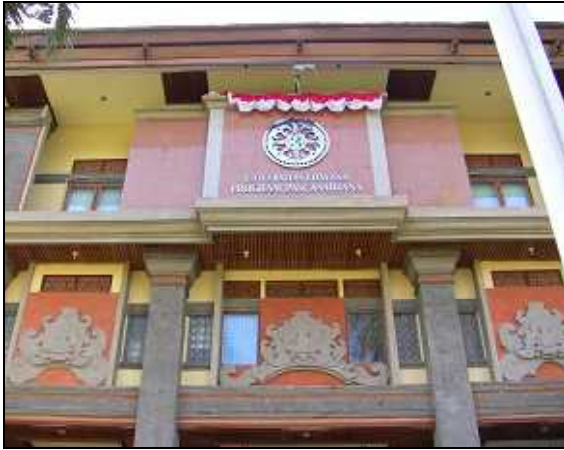
大学院本館の建物