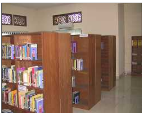
図書（全部で3架ある）