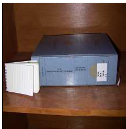
厚い論文（メモ帳の高さは7.5 cm）