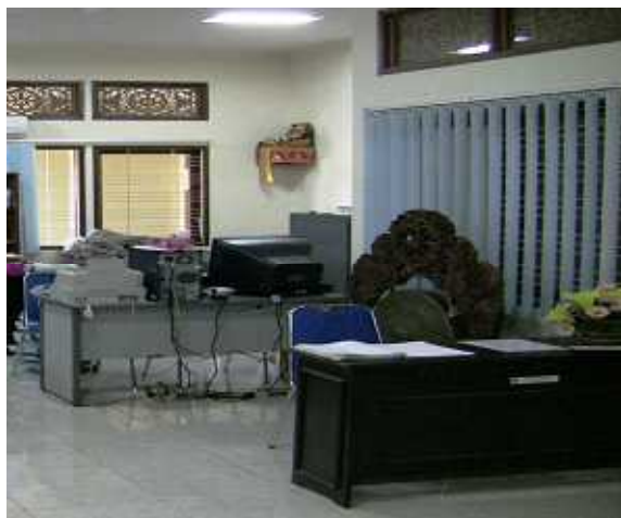
名前を書く机（手前）