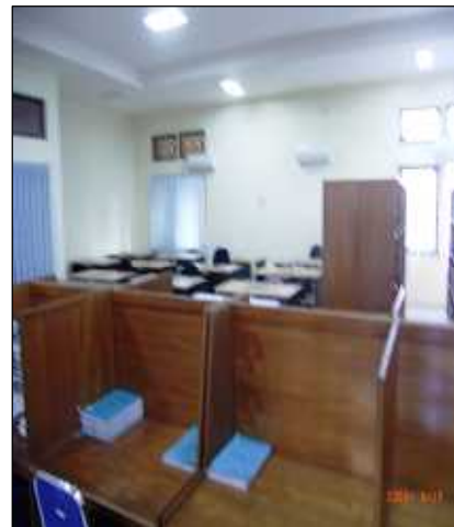
閲覧机（全部で16席ある）